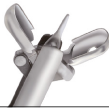
Ovale Löffel mit Dorn