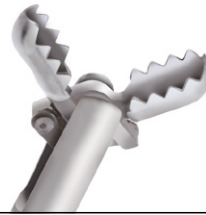
Gezahnte ovale Löffel