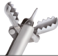
Gezahnte ovale Löffel mit Dorn